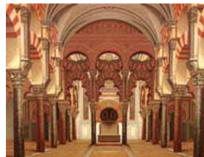
Catedral de Córdoba (Antigua Mezquita)

Córdoba supo del hombre desde el Paleolítico; los Turdetanos la convirtieron en capital del Imperio de Tartesos; la conquistó para el cartaginés el general Amílcar Barca; fue romana dos siglos antes de Cristo, en la que nacieron y vivieron Séneca y Lucano; luego la dominó Bizancio, como después los visigodos de Leovigildo.