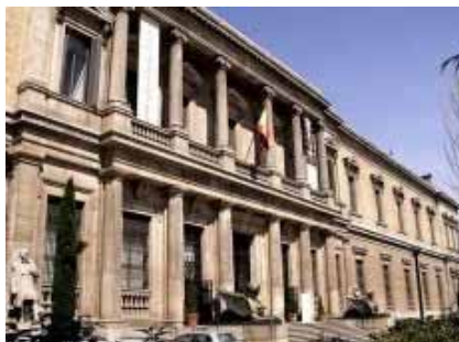
MUSEO ARQUEOLOGICO NACIONAL

El Auditorio Nacional de Música es un organismo dependiente del Instituto Nacional de las Artes Escénicas y de la Música (Ministerio de Cultura). Obra del arquitecto José M a García de Paredes, fue inaugurado el 21 de octubre de 1988 y su construcción fue programada dentro del Plan Nacional de Auditorios, destinado a dotar al país de una adecuada infraestructura musical.