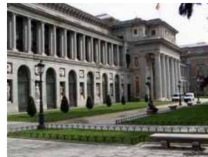
MUSEO DEL PRADO

El propósito del Museo de la Ciudad es explicar el desarrollo histórico de la ciudad, así como las infraestructuras que la conforman a través de vídeos, planos, maquetas, pantallas interactivas, etc.