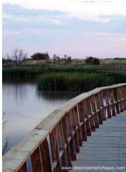
PARQUE NACIONAL TABLAS DE DAIMIEL