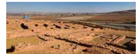
Centro de interpretación Cerro de las Cabezas

La Posada de los Portales de la localidad de Tomelloso, es un bonito ejemplo de arquitectura popular edificado a mediados del siglo XVII, con soportales de madera y estructura de una típica venta manchega, que ha sido escenario de algunas aventuras del genial detective Plinio, creado por el escritor Francisco García Pavón.